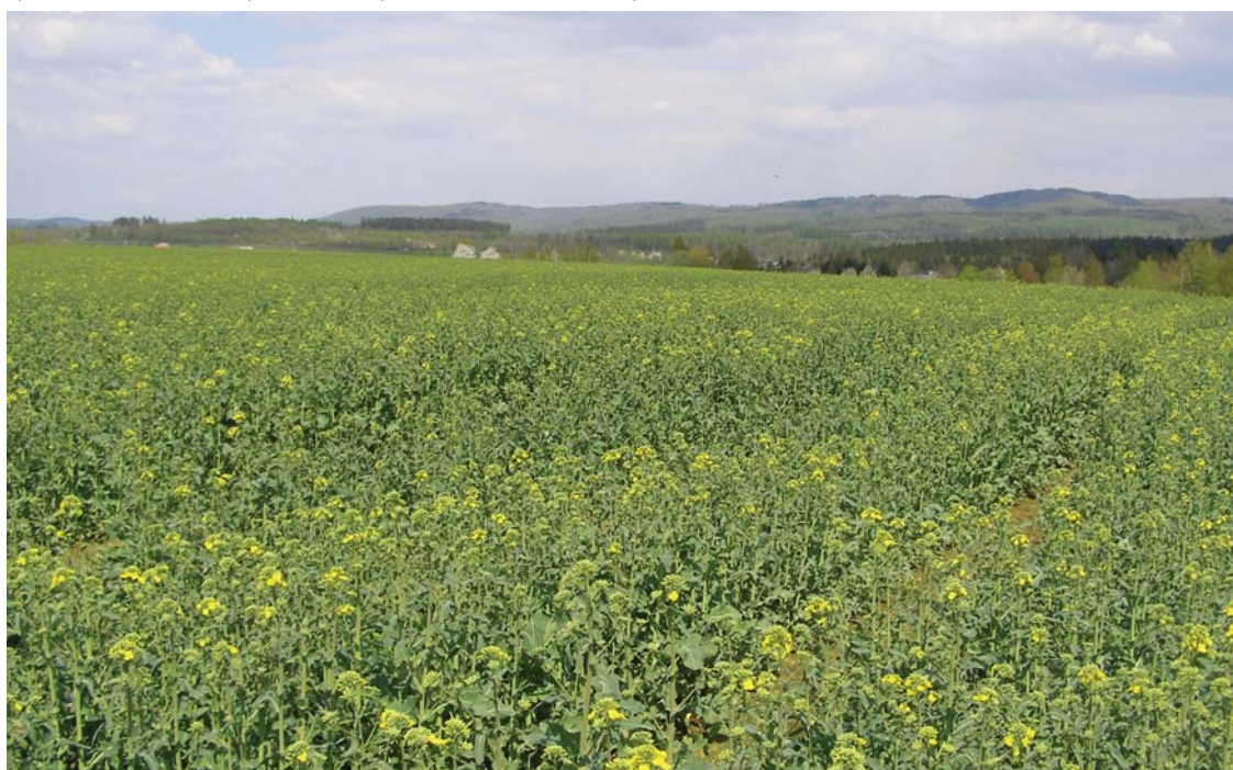
Příznivý vliv mimokořenové výživy bórem dodaným v hnojivu Yara Vita Bor je na jaře patrný